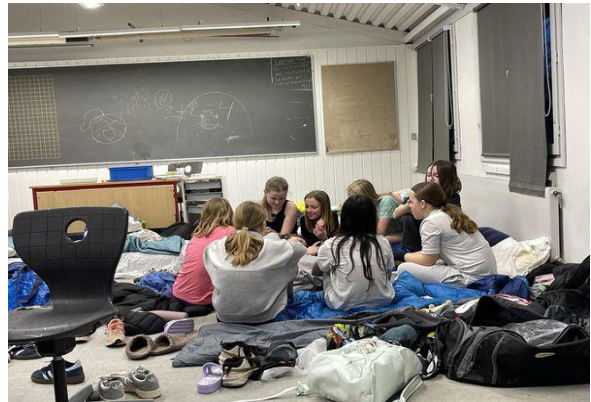
Hygge til Ishøj's kids & Teen træf 2024