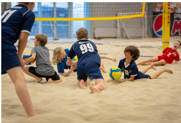
Beach-stævne i Hafnia-hallen 2023