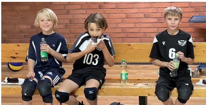
Level 3 stævne, Korsør 2023

Mod slutningen af sæsonen (og evt. i løbet af sæsonen) vurderer vi de spillere, der skal og kan rykke op til U15. I den forbindelse forsøger vi at have fælles træning for disse spillere sammen med U15-holdene. U15 er niveauet over Kids og dækker normalt spillere, som går i 7. og 8. klasse.