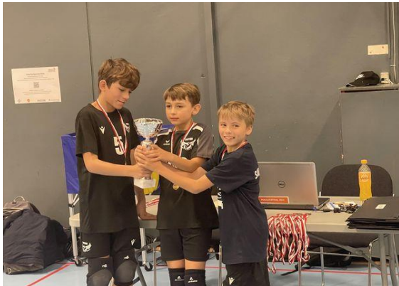
Level 4-holdet vinder pokalfestivalen i 2024